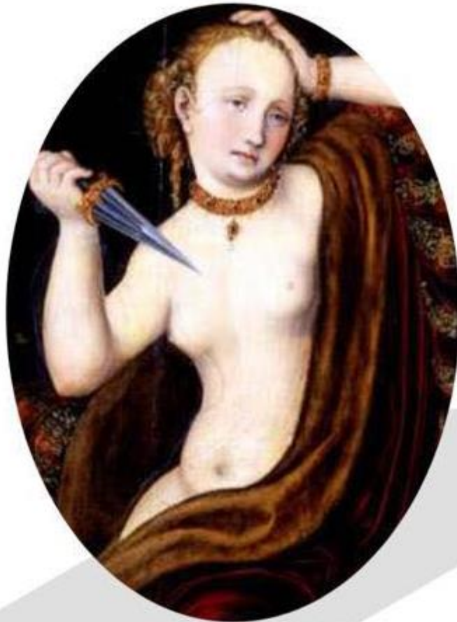
Lucas Cranach. Lucretia

“A perversidade nos engana ou escapa a nós porque ela pode tanto se dar pelo que é – perversidade, maldade, etc. – quanto pelo que não é – candura, boa-fé etc.” 3 (p.78).